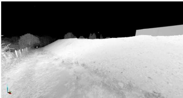
Fertiggestellter Erdbau mit Planumshöhen