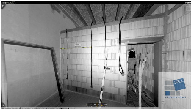
Dokumentation der Kabelführung – bevor der Putz kommt.